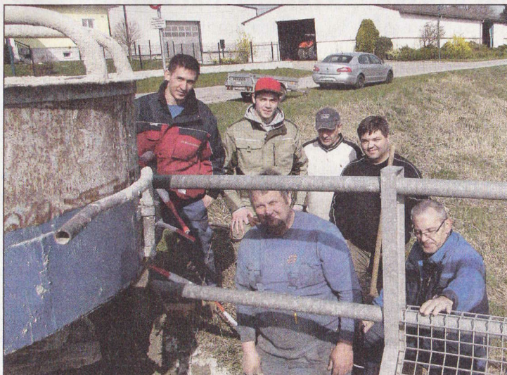
Zum ersten Mal arbeiteten Bürgermeister und Gemeinderäte gemeinsam an einem Projekt und ersparten der Gemeinde einige tausend Euro.

Die Sanierung der Bruderndorfer Brücke war die erste gemeinsame Arbeit der neuen Gemeinderäte und ersparte der Gemeinde damit mehrere tausend Euro. ■